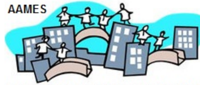
Association des Anciens du Master Ethique et Sociétés

L'objectif de l'AAMES est de rassembler les personnes qui sont ou ont été impliquées dans le Master d'éthique : anciens étudiants, étudiants en cours de formation, les membres du personnel, les intervenants, ainsi que toutes les personnes qui se sentent liées de près ou de loin au CEERE.