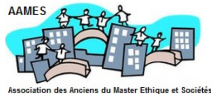
Association des Anciens du Master Ethique et Sociétés

L'objectif de l'AAMES est de rassembler les personnes qui sont ou ont été impliquées dans le Master d'éthique : anciens étudiants, étudiants en cours de formation, les membres du personnel, les intervenants, ainsi que toutes les personnes qui se sentent liées de près ou de loin au CEERE.